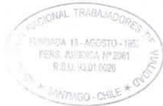
Cipriano Aldea Gacitúa Presidente Nacional